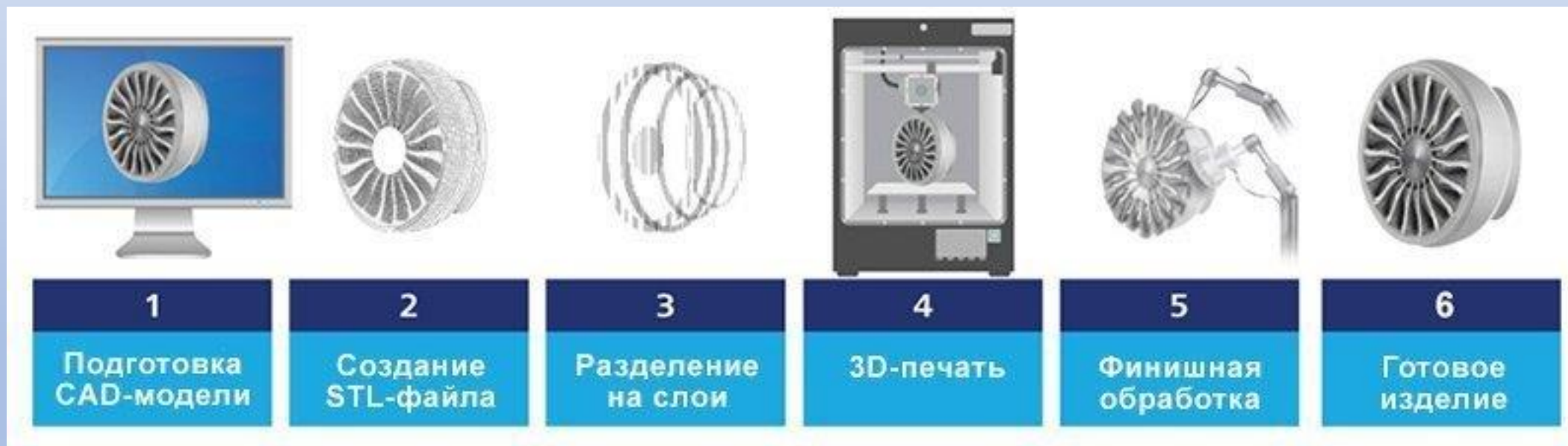
Схема процесса аддитивного производства

Под аддитивными технологиями понимается процесс изготовления изделий на основе компьютерных 3D-моделей. Построение происходит послойно, постепенно, из-за чего часто такой процесс называют выращиванием.